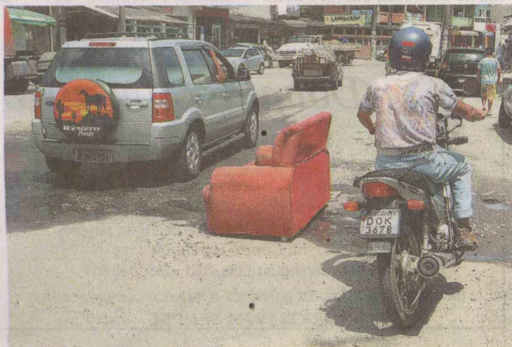
Na Avenida Tancredo Neves, sofá é usado para indicar buraco na pista

■ Após dois anos do atual Governo, os setores de Obras e Saúde praticamente dividem a liderança, na resposta à seguinte pergunta: em qual área o desempenho da prefeita Maria Antonieta de Brito foi pior?