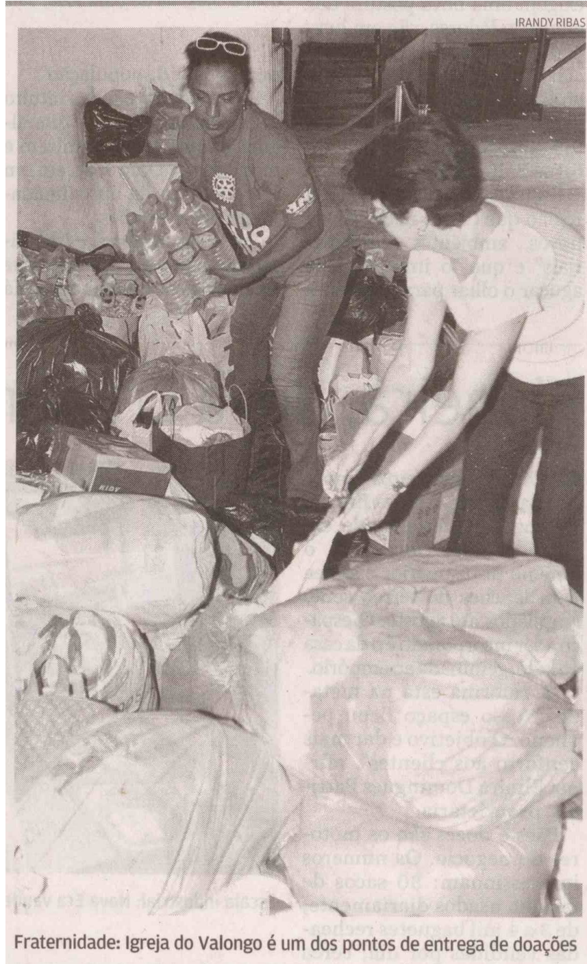
Fraternidade: Igreja do Valongo é um dos pontos de entrega de doações